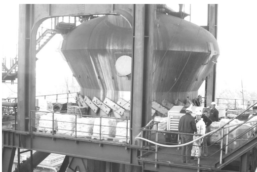
Wirblerauskleidung im Stahlwerk.